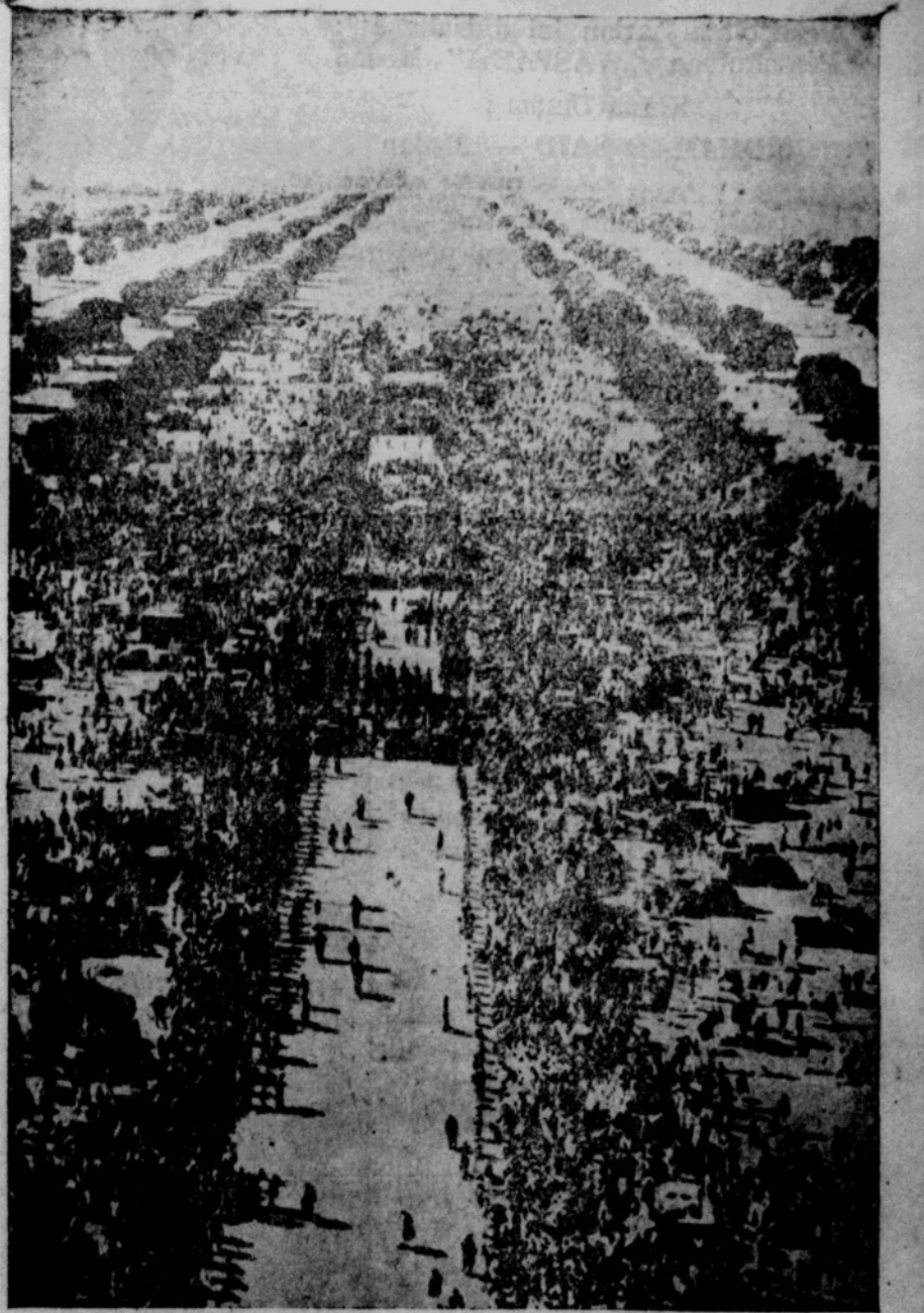
Arakan kematian (pembawaan djenazah) Mahatma Gandhi, sewaktu melalui Kingsway di New Delhi. Menurut taksiran tidak kurang 1 djuta orang jang sama turut menjatakan sedih atas kematian orang besar India itu, dan turut mengiringkan arakan kematian itu, sebagai penghormatan jang paling achir.